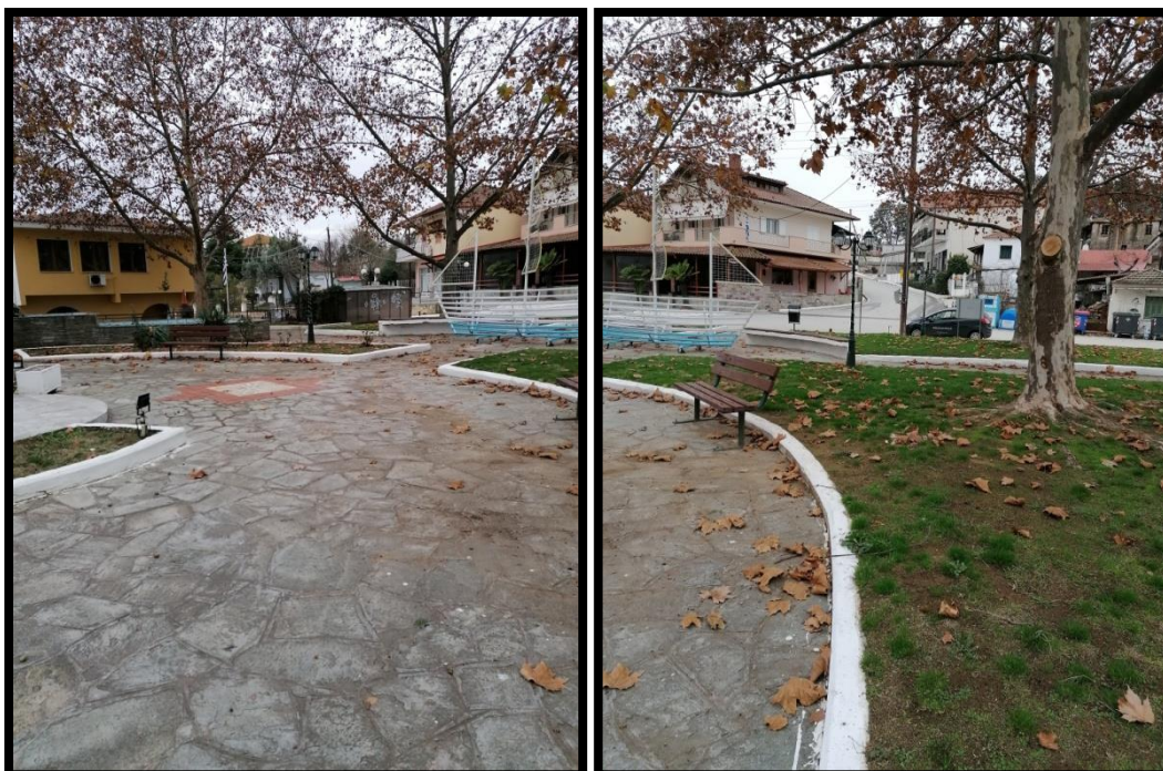
Εικόνα 5. Φωτογραφίες 5 & 6 της πλατείας Προφήτη