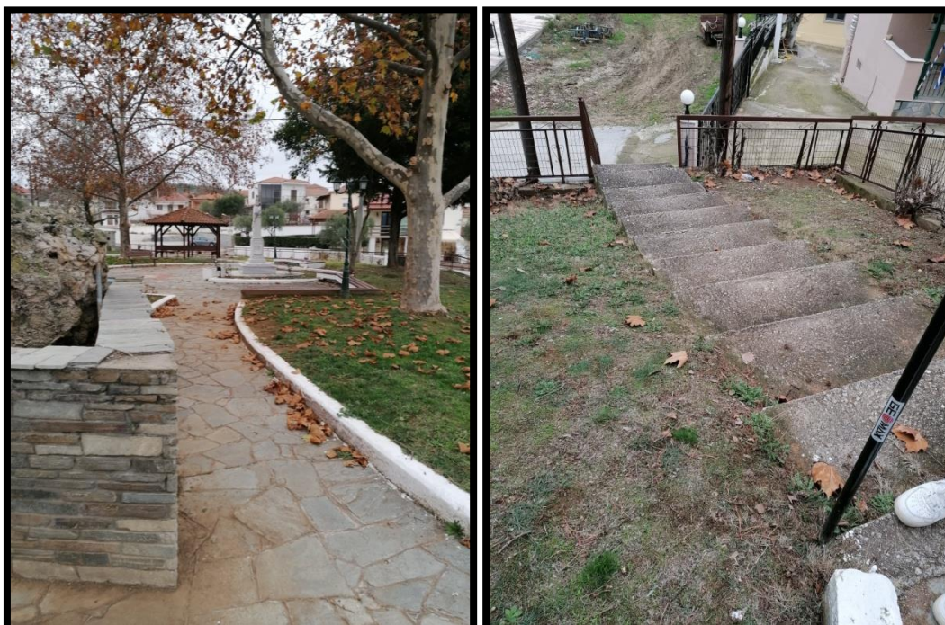
Εικόνα 4. Φωτογραφίες 3 & 4 της πλατείας Προφήτη