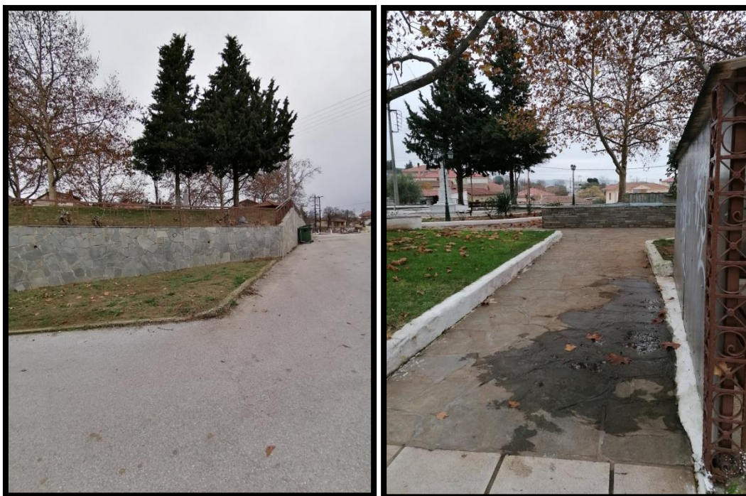
Εικόνα 3. Φωτογραφίες 1 & 2 της πλατείας Προφήτη