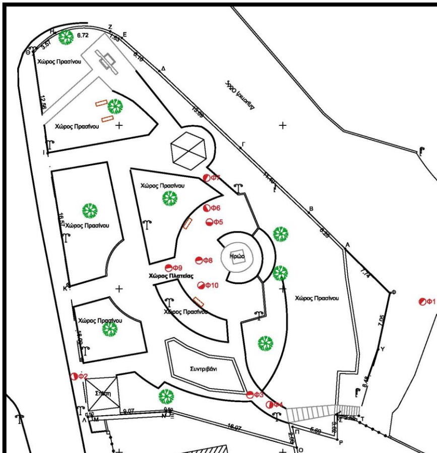
Εικόνα 8. Χάρτης της πλατείας Προφήτη, με σημείωση των θέσεων λήψης των συνημμένων φωτογραφιών