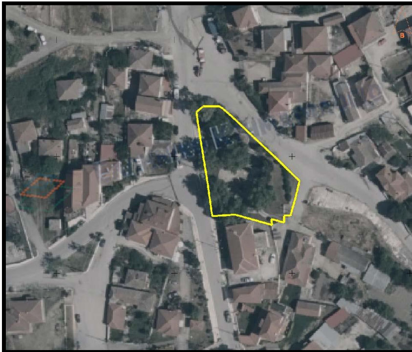
Εικόνα 2. Αεροφωτογραφία από το Ελληνικό Κτηματολόγιο της πλατείας Προφήτη του Δήμου Βόλβης, με σημειωμένα τα όρια της περιοχής παρέμβασης