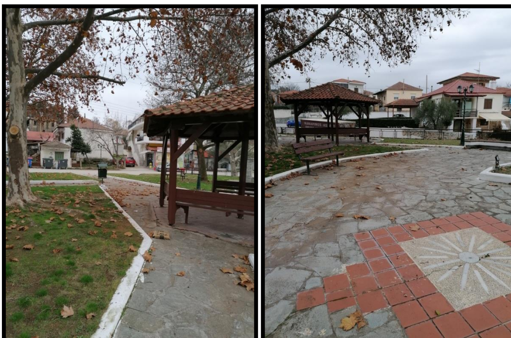
Εικόνα 6. Φωτογραφίες 7 & 8 της πλατείας Προφήτη