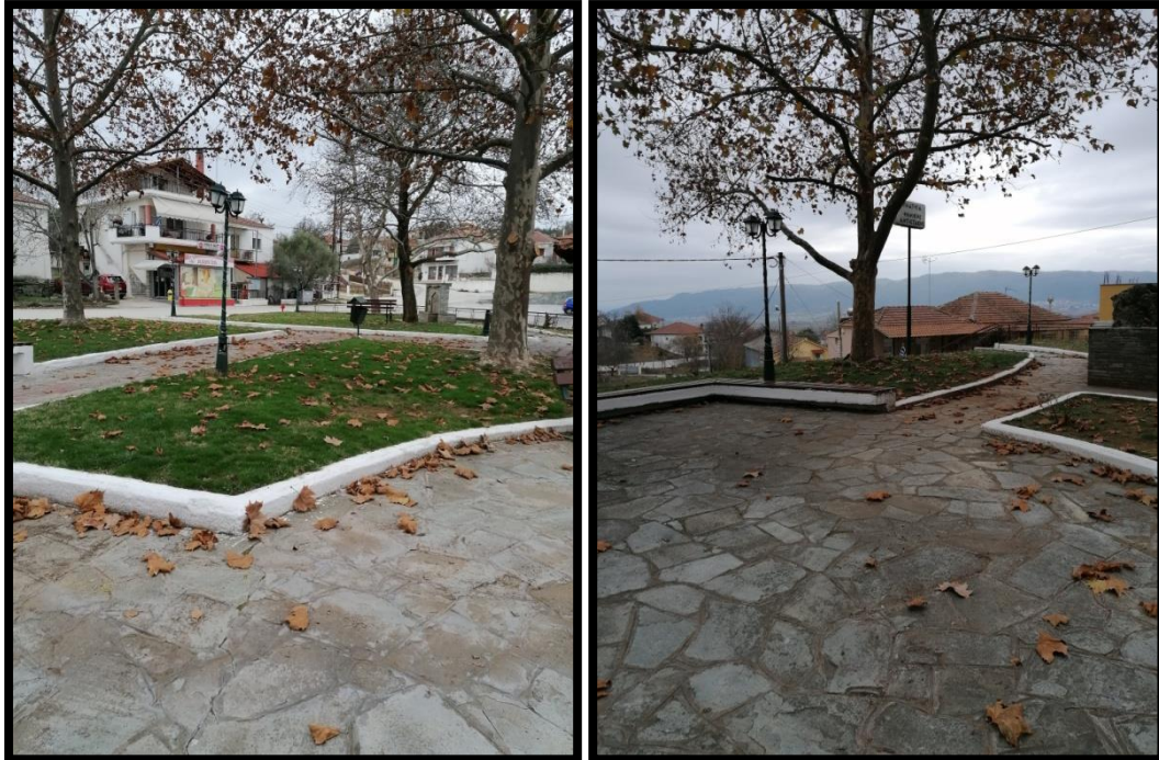
Εικόνα 7. Φωτογραφίες 9 & 10 της πλατείας Προφήτη